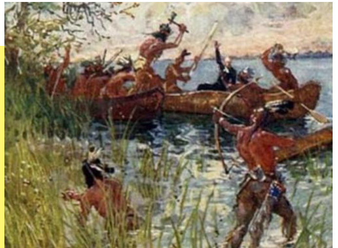
Peinture d'Henry Sandham

Pour avoir une plus grande quantité de fourrures à offrir, les Amérindiens se rendaient dans les territoires des autres nations pour chasser. Peu à peu, les animaux devenaient moins nombreux et les peuples amérindiens faisaient des guerres pour agrandir leur territoire de chasse.